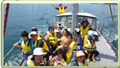
大阪湾クルージング