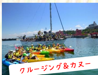
クルージング&カヌー