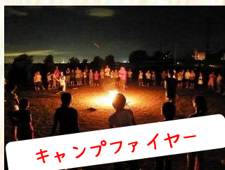
キャンプファイヤー