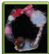
クリスマス リース作り

ファミリークリスマスキャンプでは、はくちょう号で大阪湾クルージング、家族ごとにケーキ作りをして、みんなでパーティー。