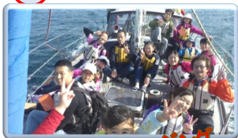
大阪湾クルージング