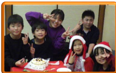
ケーキ作りと パーティー☆