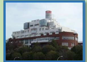
マリンロッジ海風館