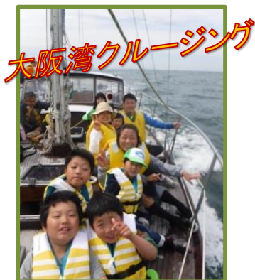
大阪湾クルージング