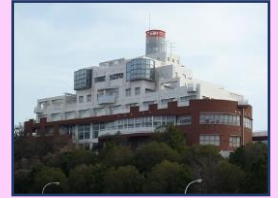
マリノロッジ海風館